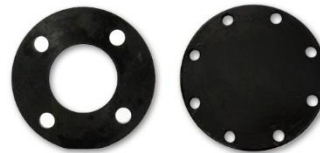
Flange em Aço Carbono/Inox e PEAD